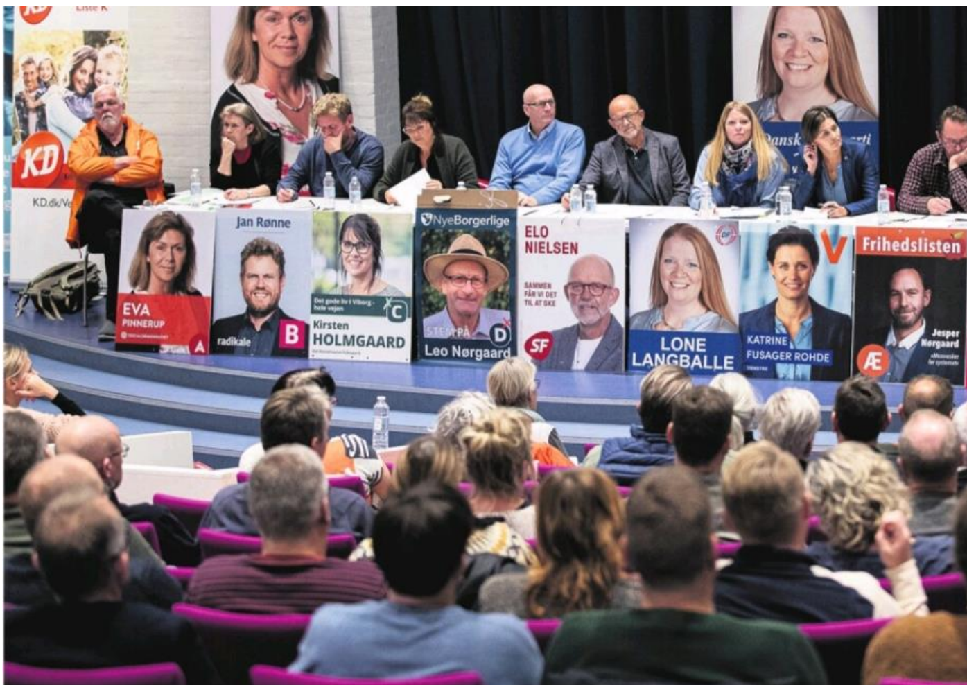
Skolelederforeningen og Viborg Lærerkreds inviterede tirsdag aften til vælgermøde. Folkeskolen var emnet.